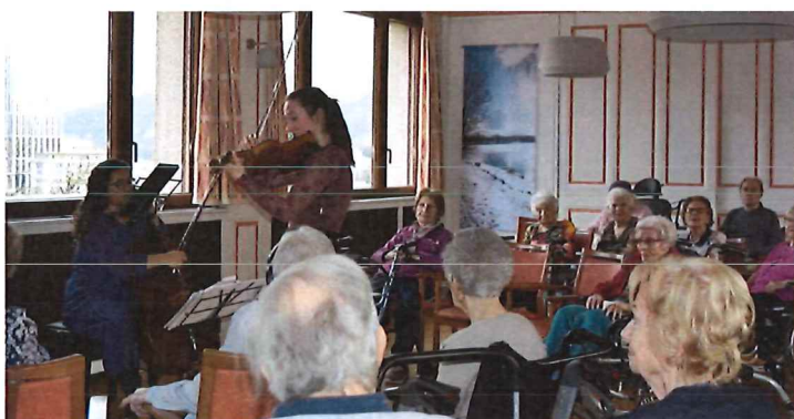
Les Concerts du Cœur, le Duo Licòrna, deux violonistes qui ravis- sent nos oreilles