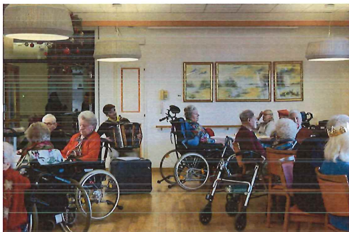
Fête des Rois avec galettes et accordéon