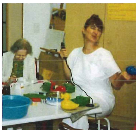
1998, préparation de jeux pour les enfants lors de la fête annuelle de La Vendée

la douleur induite par la malposition et la mobilisation dans les soins. Mes armes préférées : toutes sortes de coussins de positionnement, de fauteuils roulants manuels et électriques, des appareils de transferts manuels et électriques, des techniques affûtées de manutention qu'il faut enseigner toujours et encore pour que chaque collaborateur accompagne les résidents tous les jours avec confiance. A cette époque, les activités manuelles étaient aussi plébiscitées puisqu'elles sont un outil fabuleux pour entraîner toutes les capacités physiques, intellectuelles, sensorielles, psychosociales.